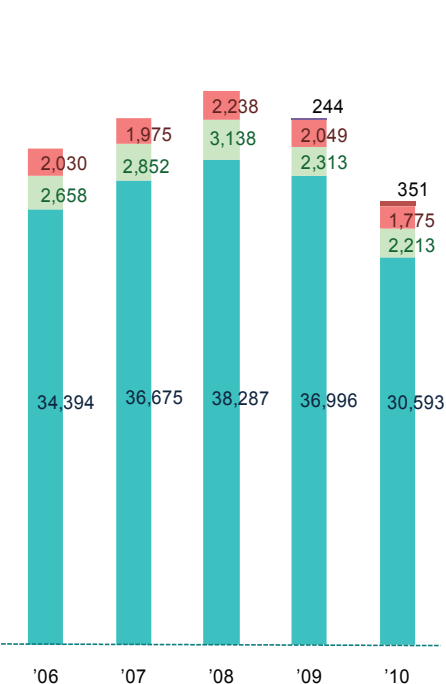
部門別売上高推移 / Changes in net sales by division

システムソリューションサービス部門 / System Solution Services Div. 情報サービス / Information Services ソフトウェアプロダクト / Software Products 人材派遣部門 / Staffing Services Div. 不動産賃貸部門 / Real Estate Services Div.