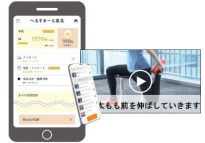
「へるすまーと泉北」フェイスイメージ